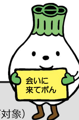
PRキャラクター トウレツポン