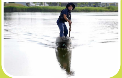
『ウポポイに音でさわる』 2021年 撮影・録音・編集・整音 春日聡 制作 国立アイヌ民族博物館