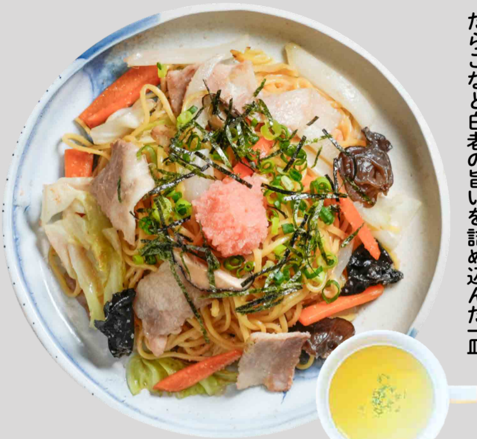
虎杖浜たらこ焼きそば Kojyohama Tarako Yakisoba ¥1,200

北海道産小麦の中細麺に自家製の肉味噌をトッピング。北海道産豚のひき肉で作る自家製肉者にんにく入り肉味噌を、特製の味噌スープに溶かしながらお召し上がりください。