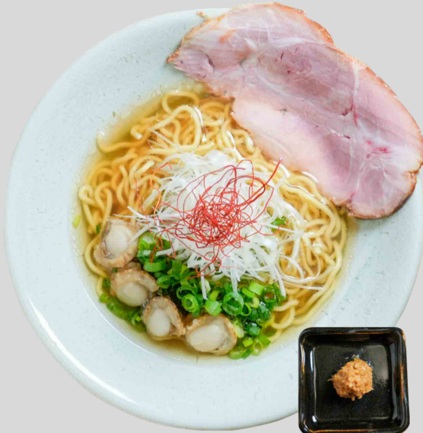
山わさび帆立醤油ラーメン Hokkaido Scallop & Horseradish Soy Sauce Ramen ¥1,200

虎杖浜のたらこ、ポロト豚、しいたけ、ペーパーホタテなど海・山・森の自然に恵まれた白老の特産品をひとつの器に詰め込みました。豚骨ベースのスープと相性抜群!