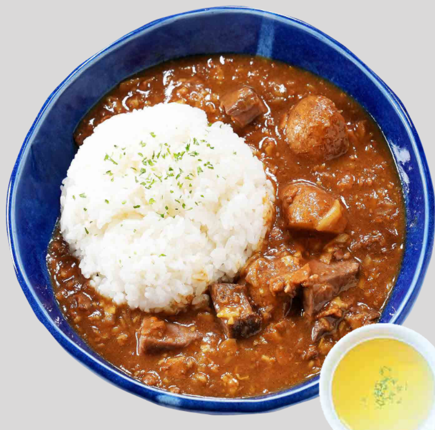
ポロト豚の角煮カレー Hokkaido Poroto Pork Braised Curry ¥1,600

しらおいちゃんぽんのスープをベースに味付けした焼きそば。ポロト豚、しいたけ、たらこなど白老の旨いを詰め込んだ一品。