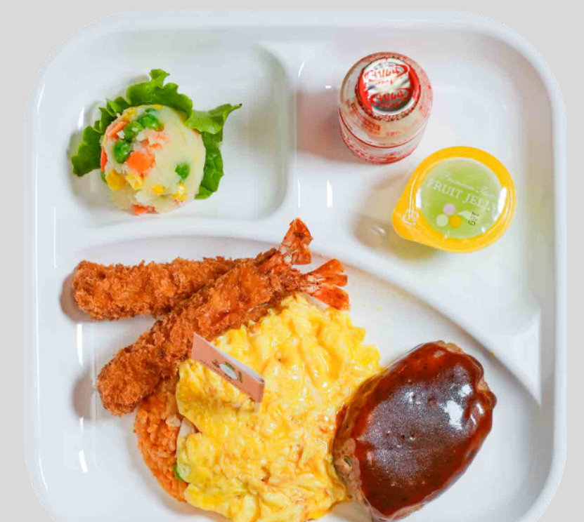
お子様ランチプレート Kids' Meal Plate ¥1,000