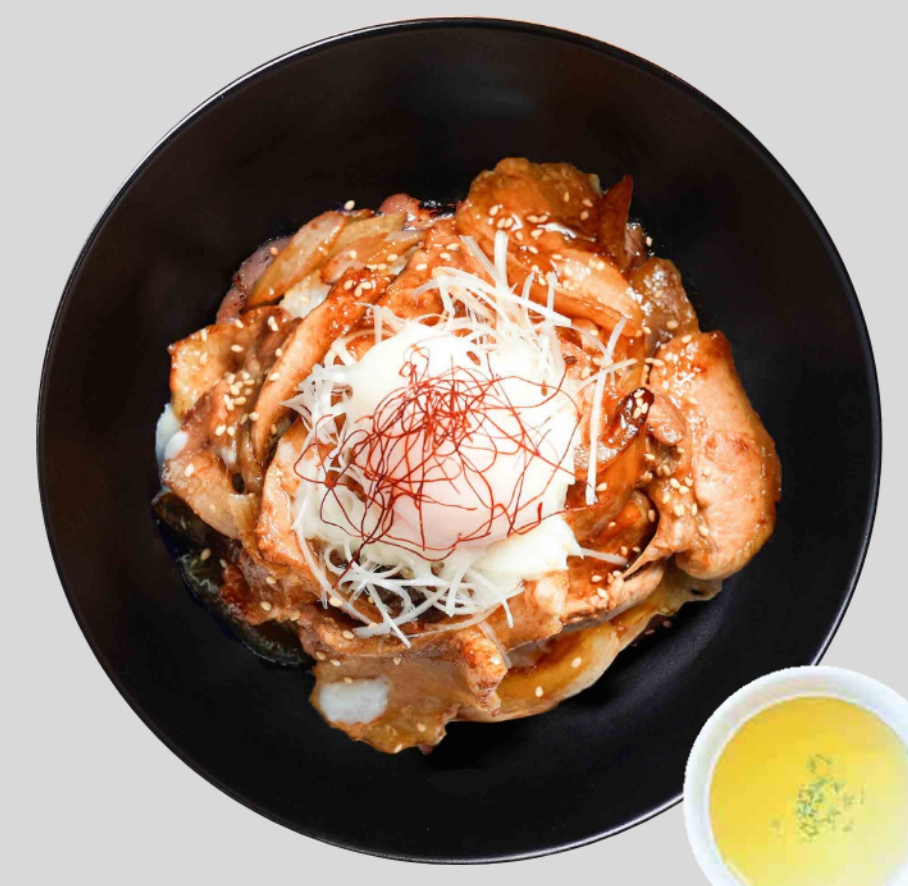
ポロト豚丼(温玉のせ) Poroto Pork Bowl (with Warm Egg) ¥1,700

白老の銘柄豚「ポロト豚」の旨みをじっくり煮込んだ角煮をゴロッと。全8種のスパイスをブレンドした当店自慢のオリジナルカレー。