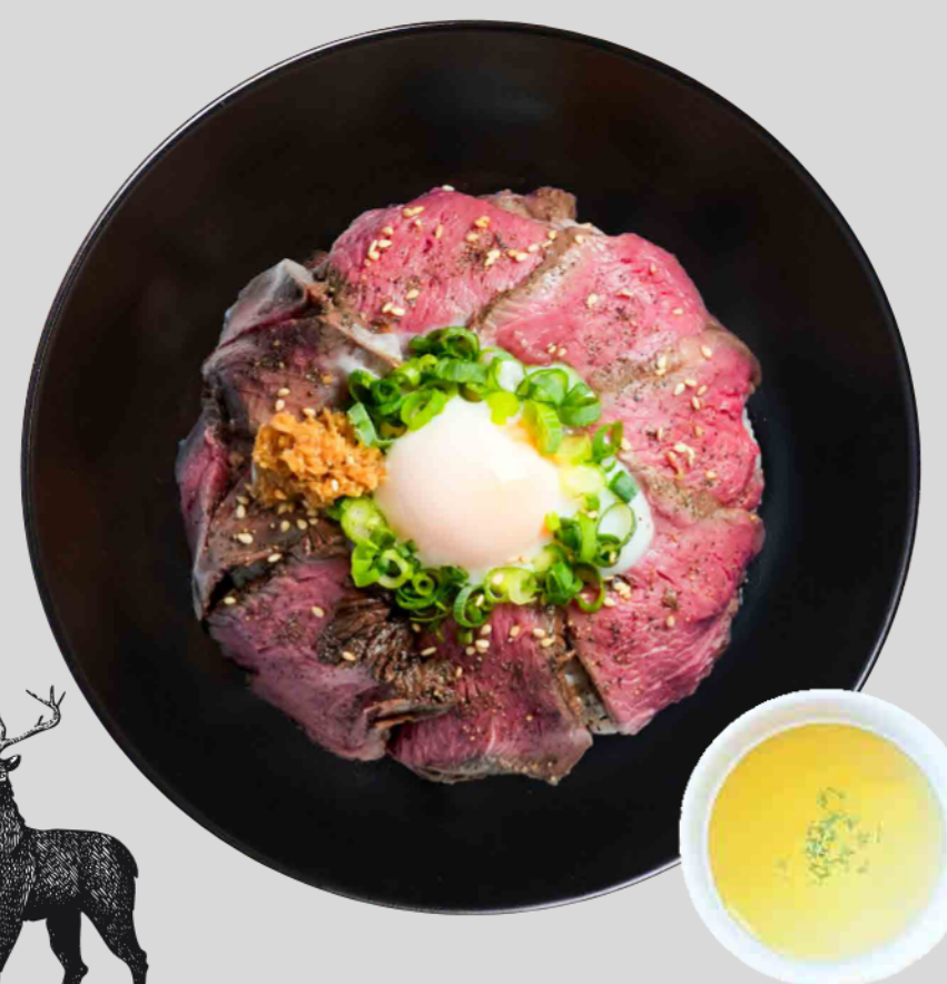
えぞ鹿丼(温玉のせ) Ezo Deer Rice Bowl (with Warm Egg) ¥1,800

柔らかく甘みのあるポロト豚をたっぷり4枚。マザーズの温玉と絡み合う甘ダレとご飯の相性も抜群。山わさびの白だし漬けを添えて。