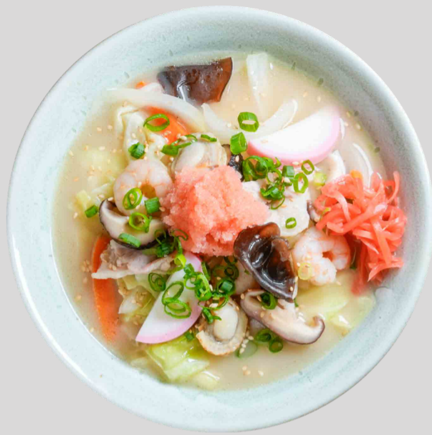
しらおいちゃんぽん Shirai Champon ¥1,500