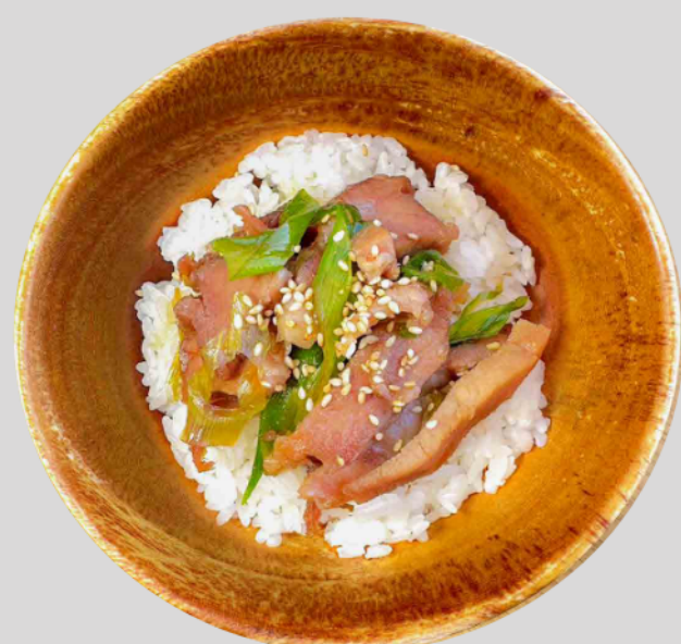
まかないチャーシュー丼(ミニ) Mini Chashu Rice Bowl (Staff Favorite) ¥500