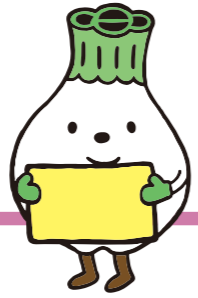
ウポポイPRキャラクター トゥレップン