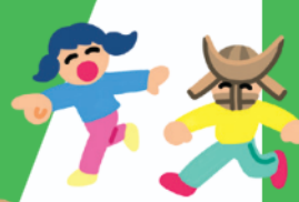
ウポポイPRキャラクター トウレットポん