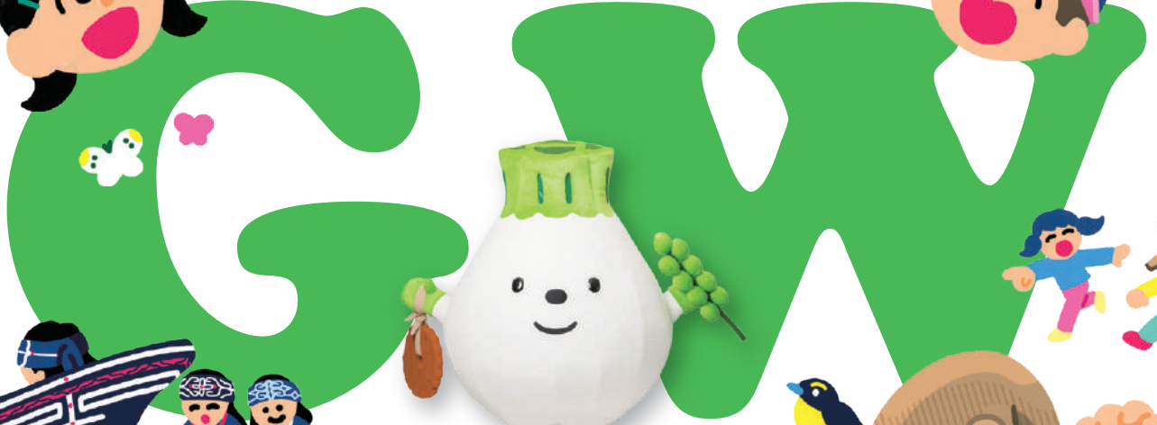
ウポポイPRキャラクター トウレッツポン